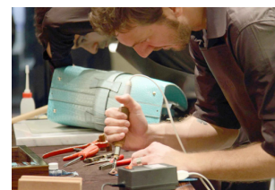
Un artigiano al lavoro

Ciononostante, la realtà economica italiana non è solo o semplicemente una questione di differenze tra Nord e Sud. Già negli anni Settanta si osservava che il concetto di divario Nord-Sud non faceva giustizia né alla complessità dell'economia italiana, fatta di piccole e medie industrie e di attività economiche artigianali in ogni parte d'Italia, né alla 'vitalità imprenditoriale' di varie località del Sud.