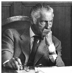
Gianni Agnelli (1921 - 2003)

Gianni Agnelli, l'erede, diventa presidente della FIAT nel 1966, e sotto la sua guida l'impresa raggiunge un grande successo attraverso la produzione di massa di utilitarie. In questo periodo, circa 400,000 automobili vengono prodotte ogni anno. Alcune automobili firmate FIAT, come la FIAT 500 e la FIAT 600, sono diventate nel tempo dei simboli del benessere